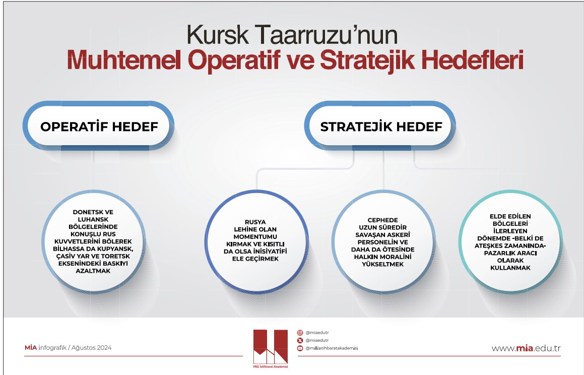
İnfoğrafik 1: Kursk Taarruzu'nun Muhtemel Operatif ve Stratejik Hedefleri

İlk olarak Ukrayna ordusunun operatif seviyedeki muhtemel hedeflerine dair bir değerlendirme yapacak olursak en makul görünen hedefin, Donetsk ve Luhansk bölgelerinde konuşlu Rus kuvvetlerini bölerek bilhassa da Kupyansk, Çasiv Yar ve Toretsk eksenindeki baskıyı azaltmak olduğunu söyleyebiliriz. Rus ordusu son dönemde bu bölgelere yoğun saldırılar gerçekleştirmekte ve önemli ilerlemeler katetmektedir. Bu bölgelerden Kursk'a asker kaydırıldığı takdirde Kiev için önemli bir operasyonel kazanım olabilir. Nitekim Rusya Silahlı Kuvvetlerinin de asker kaynağı ve olanakları sınırsız değildir. Kendi topraklarına yönelik kapsamlı bir taarruzu savunabilmek için süregelen cephelerden kuvvet kaydırması veyahut bu bölgelerde kullanmayı planladığı rezerv unsurları Kursk'a yönlendirmesi gerekebilir.