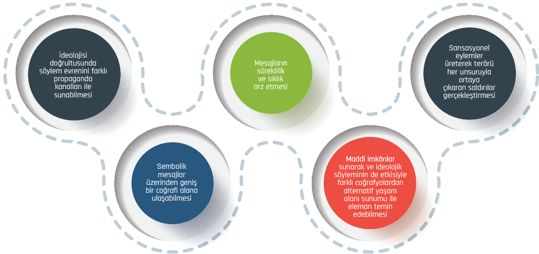
Grafik 2: DEAŞ/Horasan'ın Örgütsel Yapısını Etkili Kılan Özellikler

DEAŞ/Horasan yapılanması içerisinde yer alan kişilerin sayıları değişiklik göstermekle birlikte farklı kaynaklarda yer alan bilgiler doğrultusunda örgütün insan kaynağı teminindeki süreklilik ve insan kaynağının belli bir sayının altına düşmemesi, DEAŞ/Horasan'ın insan gücü anlamında imkân ve kabiliyeti önemli düzeyde bir örgüt olduğunu göstermektedir. 44