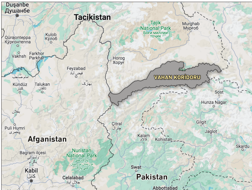
Harita 3: Vahan Koridoru

DEAŞ/Horasan, ideolojik olarak Horasan ismine atıfla Afganistan, Pakistan, Türkmenistan, Tacikistan, Özbekistan ve İran'ı hedeflediği küresel ve ulusüstü İslami kurallarla yönetilen bir halifelik kurmayı amaçladığını ifade etmektedir.