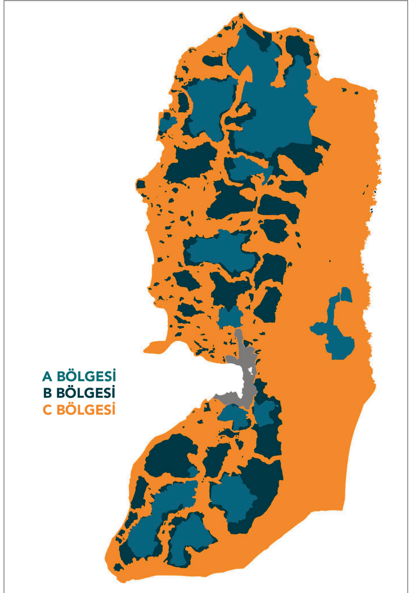
Harita 3: Oslo II Anlaşması'na Göre Batı Şeria Toprakları

Günümüzde yerleşimlerle ilgili hukuki referans çerçevesi 1995'te FKÖ ve İsrail arasında imzalanan Oslo II Anlaşması'nda belirlenmiş ve Batı Şeria toprakları A, B ve C bölgelerine bölünmüştür.