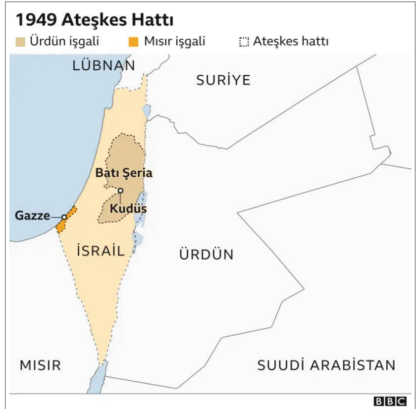
Harita 1: 1948 Savaşı Sonrası İsrail'in Politik Haritası

Bu kısımda sunulan tarihsel olaylar, geniş bir kronolojiden çok İsrail'deki radikal sağın ortaya çıkışı ve dönüşümündeki önemli dönemlere işaret etmek ve fakat bunu yaparken de konuyu dağıtmamak amacıyla belli bir odak etrafında ele alınmıştır. Büyük İsrail, ülkede radikal sağı destekleyen Yahudilere göre İsrail'in egemen olması gereken toprakları ifade eden bir kavramdır. Her ne kadar kuruluşundan sonra İsrail'in Nil'den Fırat'a dek olan bölgede Tevrat'taki referanslara bağlı kalarak yayılma planlarının olduğu popüler bir görüş olageldiyse de Büyük İsrail olarak adlandırılan bölge, Tevrat'ın farklı kısımlarında farklı sınırlarla tanımlanmıştır (Brenner, 2018). İsrail'in kuruluş süreci ve sonrasındaki farklı dönemlerde de İsrail radikal sağının Büyük İsrail olarak tanımladığı toprak parçası, politik bağlama göre farklı sınırlarla ifade edilmiştir (Sprinzak, 1991). Vadedilmiş topraklar ve Kenan diyarı gibi isimlerle de adlandırılan bu toprak parçasının İbranicedeki ismi ישראל השלמה /Yisrael Haşlema, Türkçeye "Bütün İsrail" olarak da tercüme edilebilir.