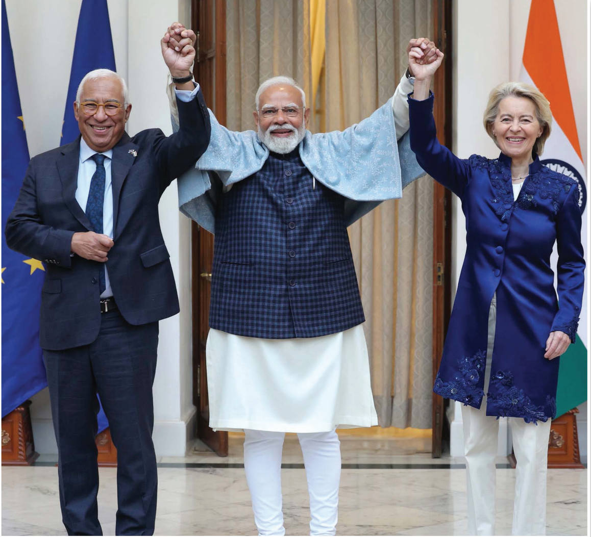
Fotoğraf 1: Narendra Modi (ortada), Ursula von der Leyen (sağda) ve António Costa (solda)

Siyasi perspektiften ise Hindistan, ABD-Çin rekabetinin keskinleştiği bir ortamda dış politikasını dengelemek istemektedir. AB ile derinleşen ekonomik ilişkiler, Hindistan'a hem siyasi hem de stratejik manevra alanı sunmaktadır. Hindistan, imzalanan STA ile küresel norm, standart ve sürdürülebilirliğe daha hızlı-derin entegre olabilecek; uzun vadede ekonomik dönüşümünü destekleyebilecektir.